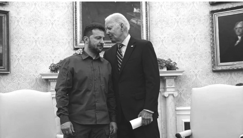
Владимир Зеленский и Джо Байден

закрытия границ. Мировые миграционные волны, как правило, связаны не только с ужасающими военными конфликтами в странах Ближнего и Среднего Востока, но и с потребностями самих капиталистических экономик европейских стран в новой и дешевой рабочей силе с целью снизить затраты производства на заработную плату европейских рабочих, объединенных в свои мощные профсоюзы. Бесправные мигранты, работающие за гроши, сейчас активно заполняют рынки рабочей силы Западной Европы. И Восточная Европа аж никак не станет неким исключением из общих правил капиталистической экономики.