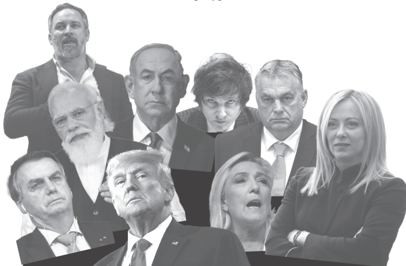
Абаскаль, Нетаньяху, Милей, Орбан, Моди, Болсонару, Трамп, Ле Пен и Мелони

Хотя различные ультраправые популистские силы очень неоднородны, они имеют общую основу, которая их идентифицирует. Они являются ксенофобами, расистами и мизогинистами. Они открыто защищают социальное неравенство как естественное явление и яростно выступают против любого вмешательства буржуазного государства с целью его смягчения. Они глубоко индивидуалистичны, элитарны и меритократичны. Они обвиняют людей в бедности и нищете и отказываются оказывать им какую-либо помощь за счет общественных ресурсов.