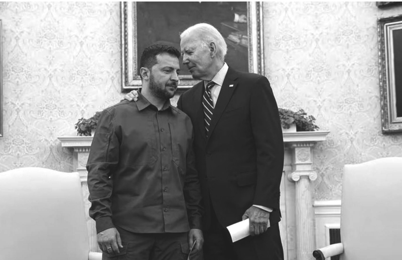
Володимир Зеленський і Джо Байден

Докорінне розв'язання як світової проблеми міграції, так і всіх інших проблем, на яких спекують ультраправі, стане можливим тільки