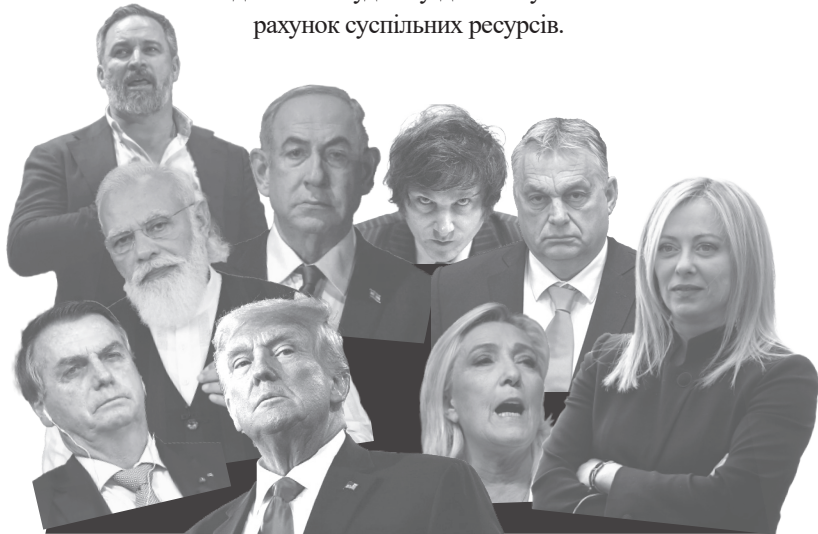
Абаскаль, Нетаньяху, Мілей, Орбан, Моді, Болсонару, Трамп, Ле Пен і Мелоні.

Хоча різні ультраправі популістські сили дуже неоднорідні, вони мають спільну основу, яка їх ідентифікує. Вони є ксенофобами, расистами та мізогіністами. Вони відкрито захищають соціальну нерівність як природне явище і люто виступають проти будь-якого втручання буржуазної держави з метою її пом'якшення. Вони глибоко індивідуалістичні, елітарні та меритократичні. Вони звинувачують людей у бідності та злиднях і відмовляються надавати їм будь-яку допомогу за рахунок суспільних ресурсів.